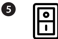
5 DESLIGUE A UNIDADE