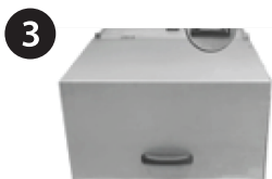
3 APERTE O BOTÃO DE LIGAR