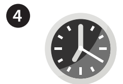
4 GIRE O TEMPORIZADOR ESPERE PELO MENOS 20 SEGUNDOS