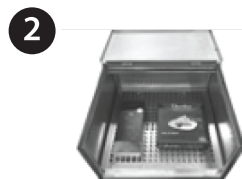
2 COLOQUE OS PRODUTOS