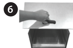
6 ABRA A TAMPA