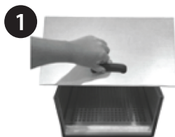
1 ABRA A TAMPA